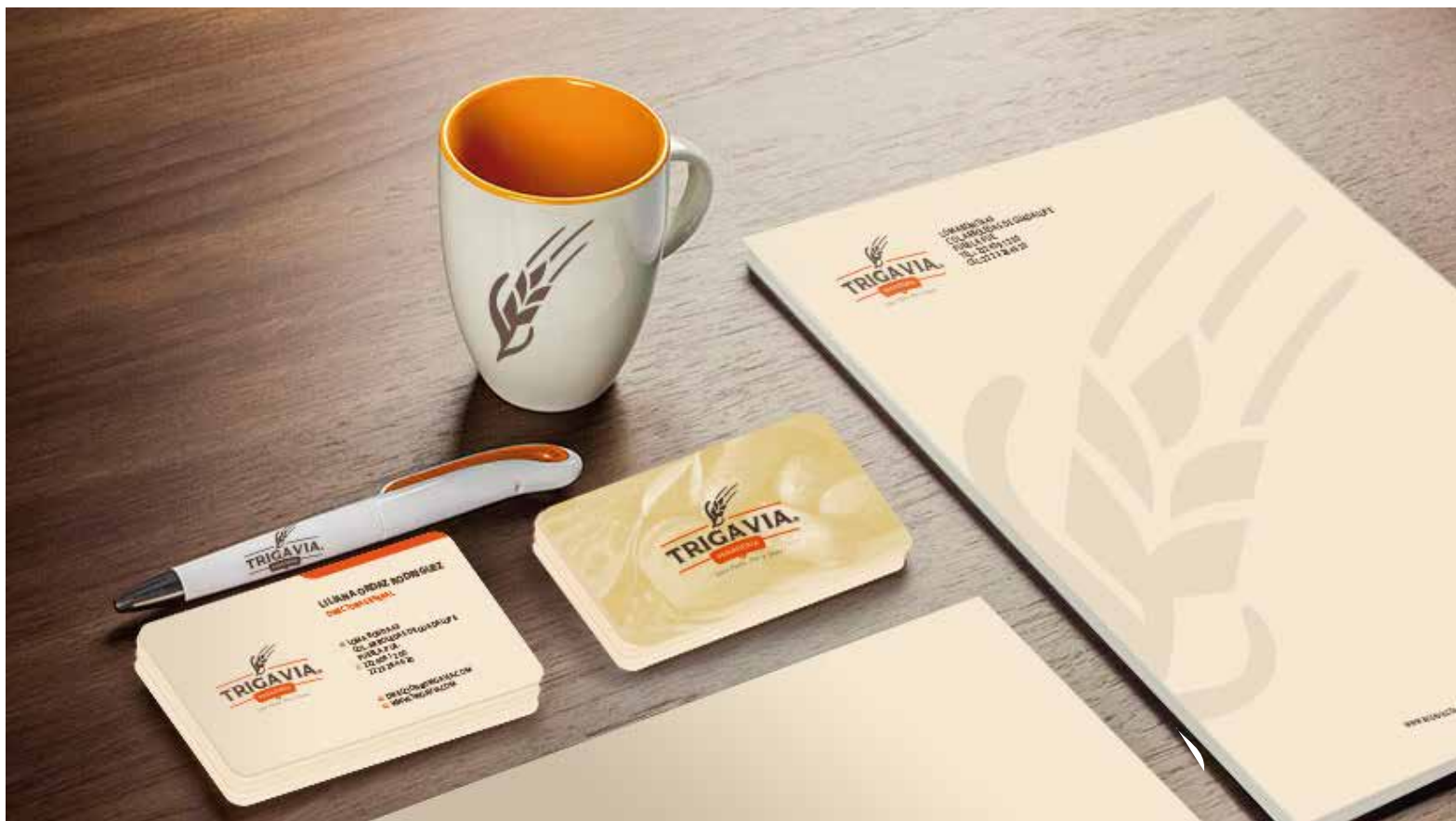
Proyecto: Logotipo aplicado a Programa de identidad Corporativa

A Continuación una Breve Muestra de lo que podemos hacer para Ayudarlo a Construir Su Marca: