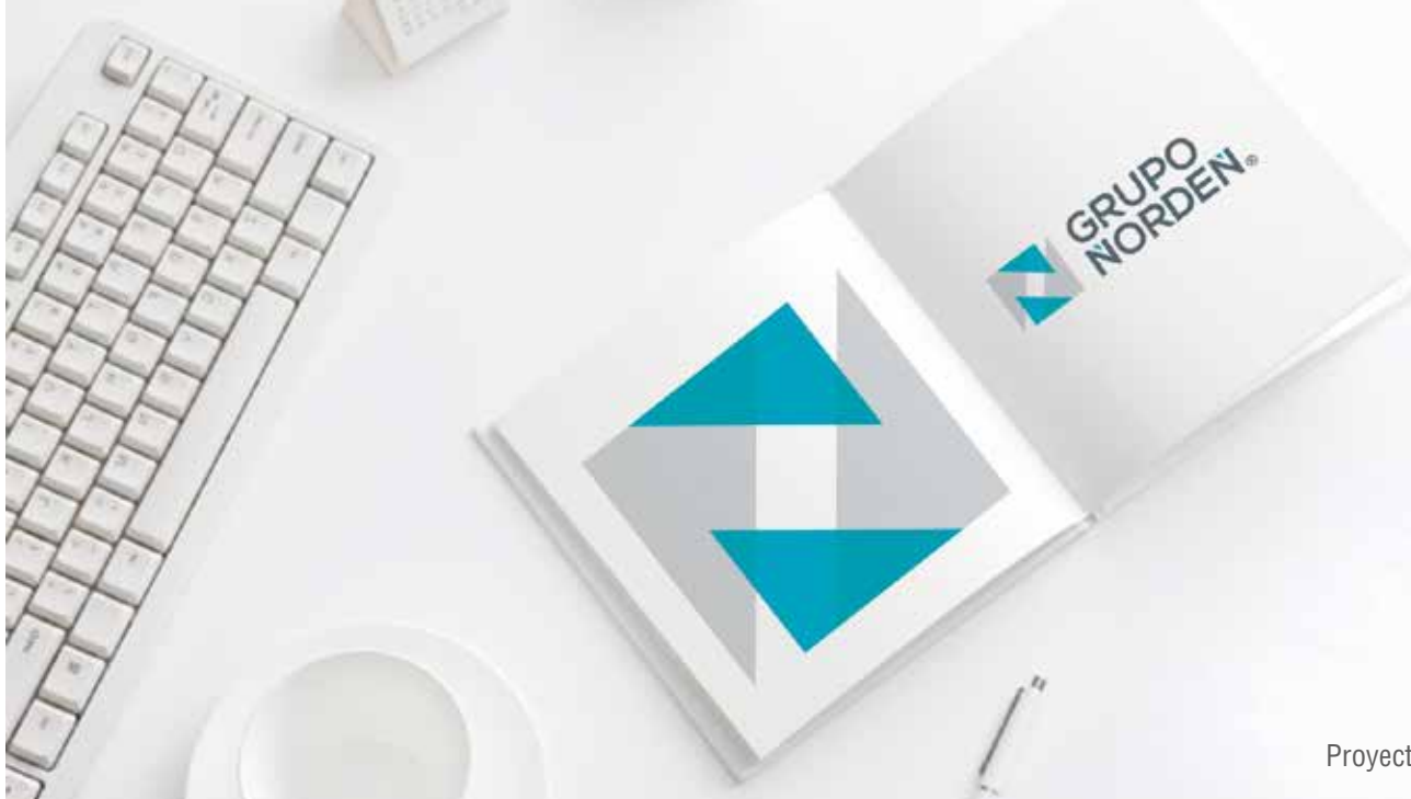
Proyecto: Diseño de Logotipo