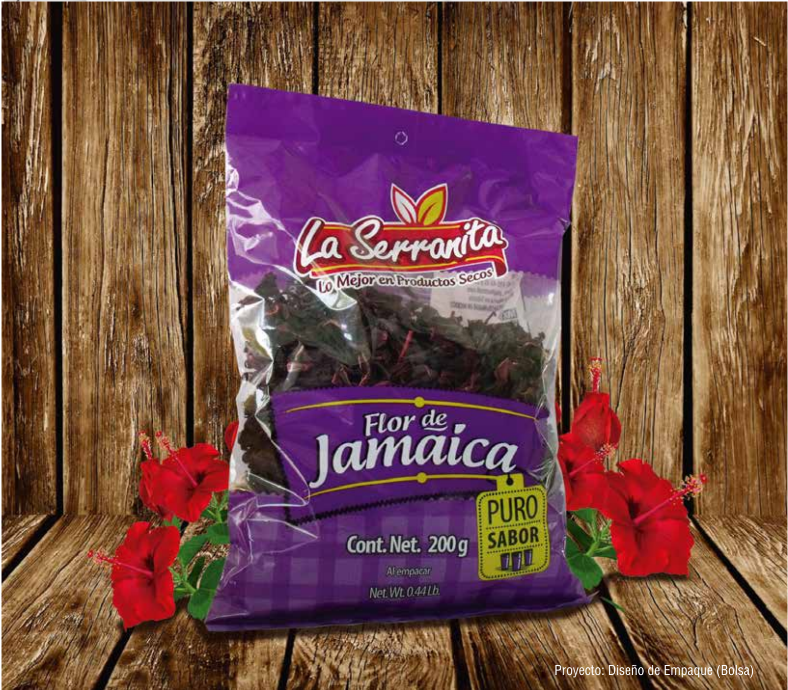
Proyecto: Diseño de Empaque (Bolsa)