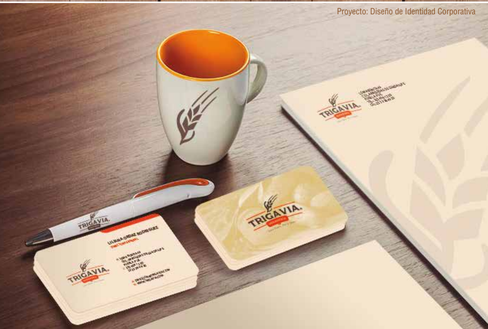
Proyecto: Diseño de Identidad Corporativa