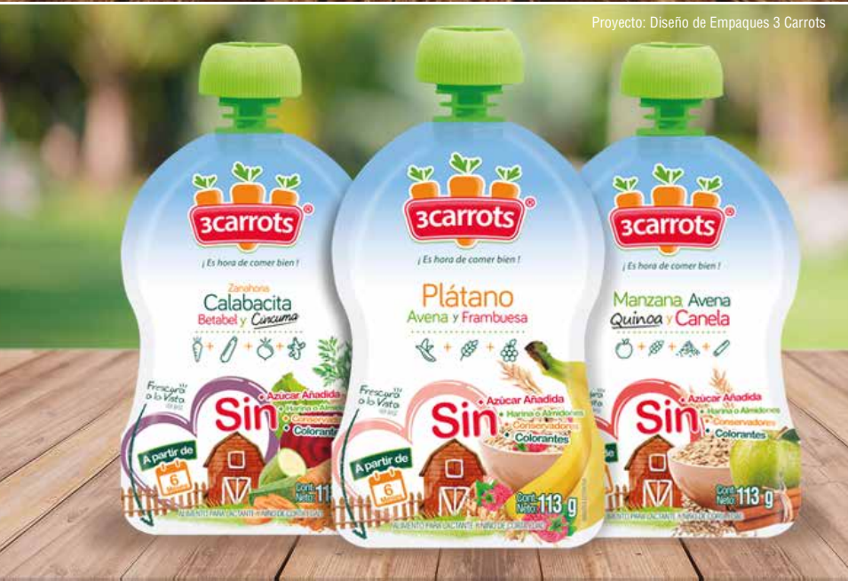
Proyecto: Diseño de Empaques 3 Carrots