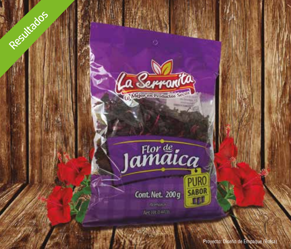
Proyecto: Diseño de Empaque (Bolsa)